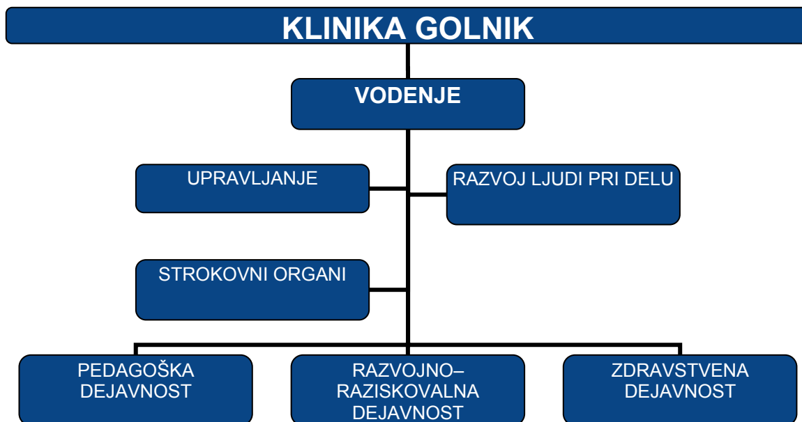
Slika 1: Organigram Klinike Golnik