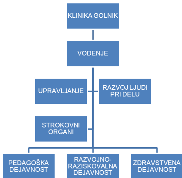
Slika 1: Organigram Klinike Golnik