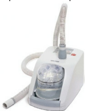
CPAP naprava (brez maske)

Aparat CPAP je preko cevi povezan z masko, ki pokriva pacientov nos (ali oboje, nos in usta, če pacient uporablja obrazno masko). Preko maske se v dihala dovaja zrak pod pritiskom, ki znaša od 4 do 15 cm vodnega stolpca. Zrak pod pritiskom »razpihuje« (razmakne) oviro, ki sicer nastane v zgornjih dihalih. Dihanje je zato lahko normalno, prekinitve dihanja izginejo, bolnik ne smrči več, podnevi pa izginejo tudi simptomi prekomerne zaspanosti.